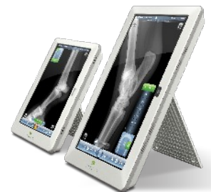
Tablette de lecture 12" ou 20"