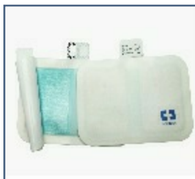
Plaque Retour CP601019 HRA5