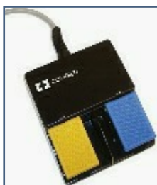
Pédale Monopolaire CP604003 E6008B